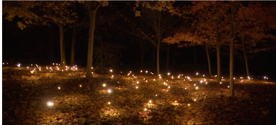
Firefly Field (Studio Toer)