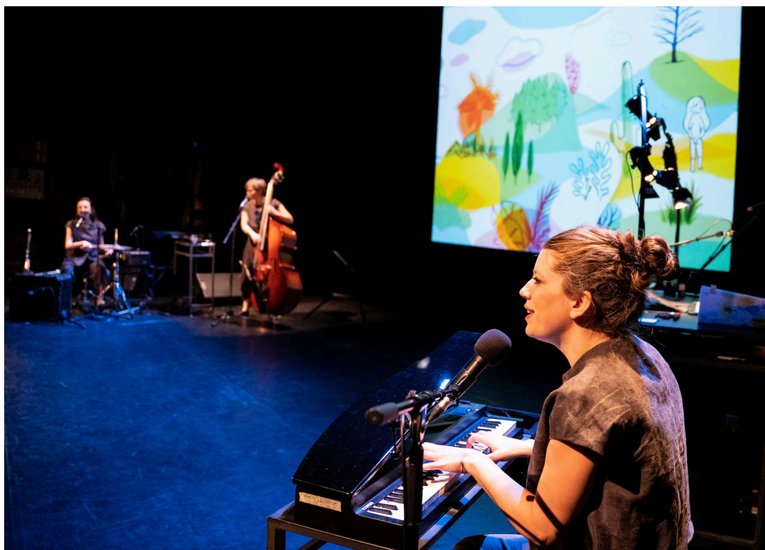
- Perséphone ou le premier hiver -